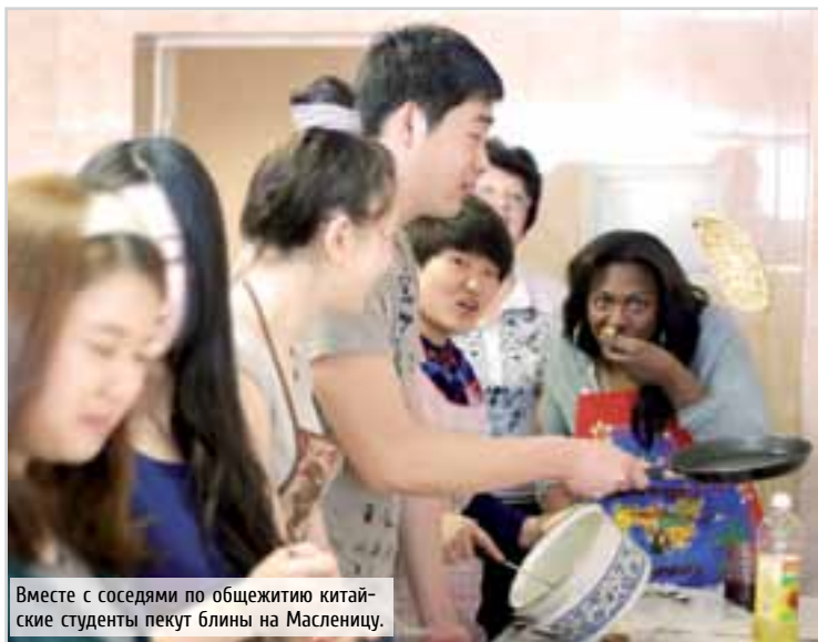
Вместе с соседями по общежитию китайские студенты пекут блины на Масленицу.

дополнительную программу подготовки к поступлению в партнерский вуз. Затем студенты продолжают обучение за рубежом и в итоге получают диплом «Bachelor of Business Administration» вуза-партнера. Во ВГУЭС студент защищает выпускную работу и полу-