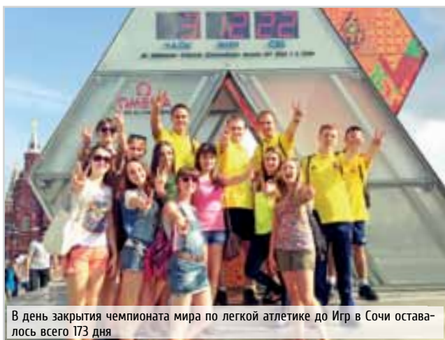
В день закрытия чемпионата мира по легкой атлетике до Игр в Сочи осталось всего 173 дня

Не успели волонтеры ВГУЭС приехать с XXVII Всемирной летней Универсиады, прошедшей с 6 по 17 июля в Казани, как получили приглашение помочь в Москве – на четырнадцатом чемпионате мира по легкой атлетике. О новом опыте работы и соревнованиях, собравших лучших легкоатлетов мира, рассказывают сами волонтеры.